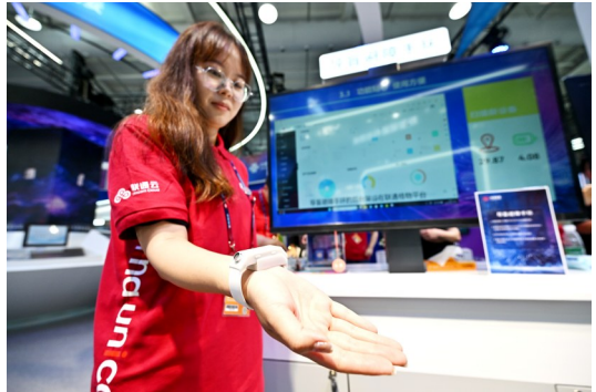
▲9月3日，首钢园中国联通展台的一名工作人员展示一款基于超声波技术的导盲避障手环。