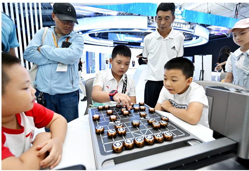
▲9月3日，小朋友在首钢园与一款象棋机器人对弈。

“数字人+金融服务”在金融专题展区随处可见。在北京银行展台前，记者看到前来与数字人互动的观众们排起了长队。模拟数字人虚拟形象，自建京智大模型，利用AIGC（生成式AI）赋予语音能力，能根据问题生成回答、上下文互动，观众与数字人实现沟通、互动和交流，了解最新金融产品介绍。“未来银行业将依托金融大模型技术，积极探索AIGC大模型技术在智能客服、产品营销、风险防控、协