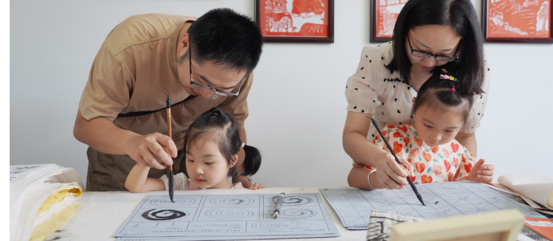
9月16日，国网池州市贵池区供电公司开展清廉皖电“家风助廉月”暨“亲情助廉”主题活动。活动由观“廉”片、创“廉”品、寄“廉”语等环节组成，通过家属携手、亲情助廉，促进干部职工培育良好家风。图为活动现场。

为盘活低效闲置用地，池州高新区结合亩均效益评价结果综合施策，通过并购、租赁、股权合作等市场化运作方式，盘活浙宇科技等3家企业闲置土地226亩。针对效益不高、未履行入园协议、欠租金额较大的人标房企业，实行“一企一策”清退整合。今年计划清退企业7户以上、整合企业10户以上。