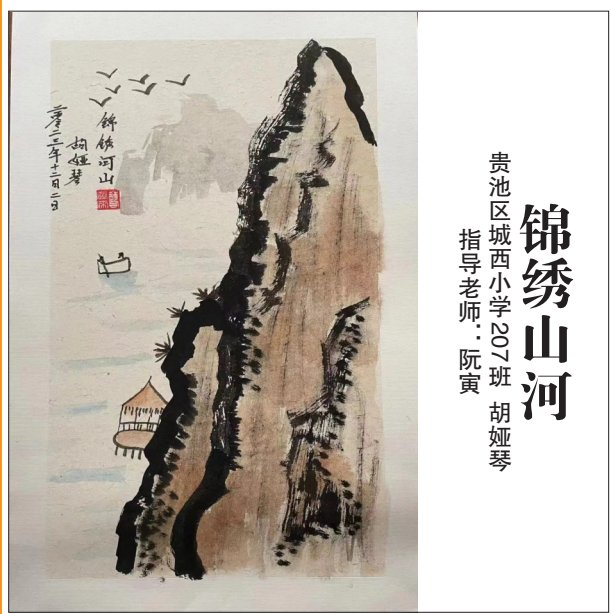
贵池区城西小学207班 胡娅琴 指导老师：阮寅 锦绣山河