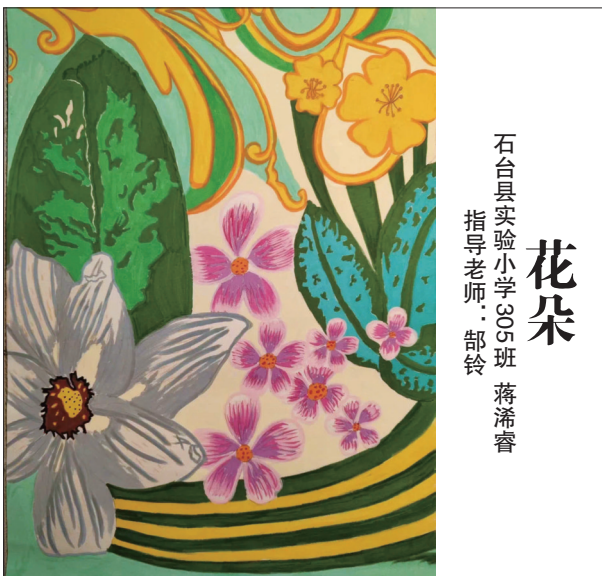
石台县实验小学305班 蒋潘睿 指导老师：邵铃 花朵